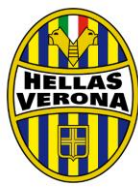
HELLAS VERONA F.C.